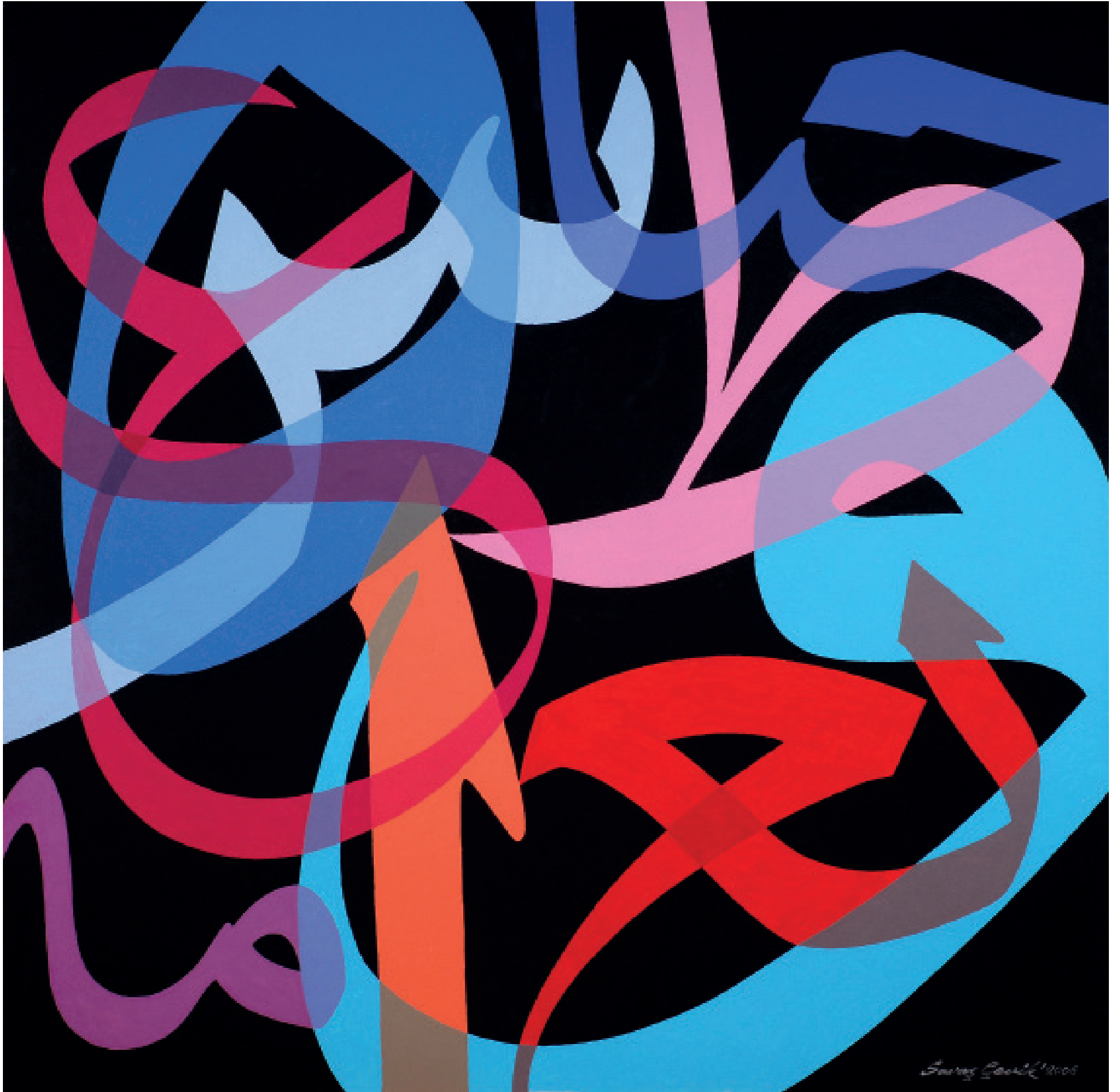
Celî Sülûs Serbest Harf Kompozisyonu