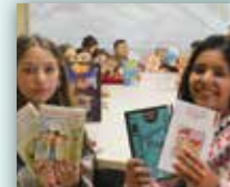
ANLAYARAK HIZLI OKUMA

Bilgi Evleri Atölye Çalışmaları Tarih Aralığı: 07 Ekim 2019 / 17 Nisan 2020 Bilgi İçin : 0212 413 11 11